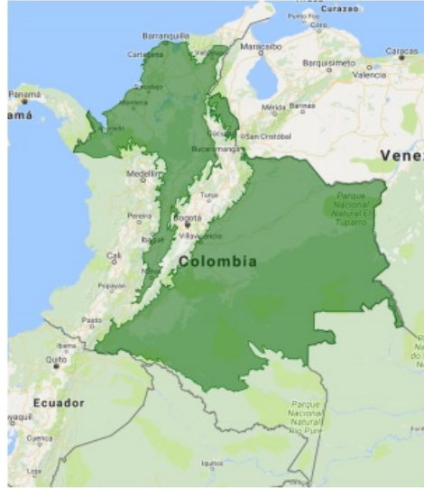
Distribución geográfica de la lora real ( Amazona ochrocephala )

https://avibase.bsc-eoc.org/species.jsp?lang=ES&avibaseid=C360AA2FB43A0820&sec=map